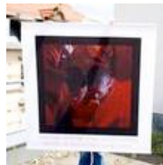
Bild mit 500 Namen zum Geburtstag von Dalai Lama -