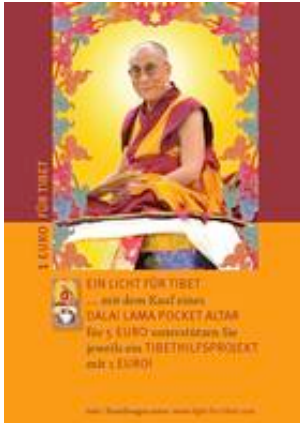
Dalai Lama Pocket Altar, Hilfsprojekt für Tibet - Tamara von Rechenberg

Mit dem Dalai Lama Pocket Altar und dem Kunstprojekt Together, ein Bild zusammengesetzt aus Namen, erhalten Hilfsprojekte in Tibet Unterstützung.